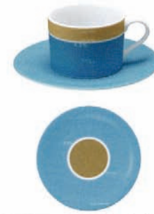
Cup & saucer / D / 2007 / Creation Gallery GA