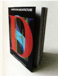
Whitson Architecture AD+D&P / 2008 / MCM Creations