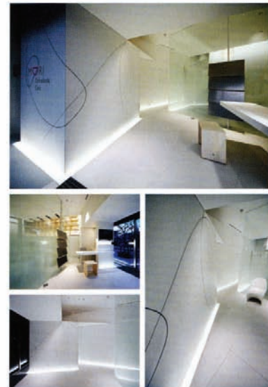
Mari Orthodontic Clinic AD+D / 2008 / Mari Orthodontic Clinic