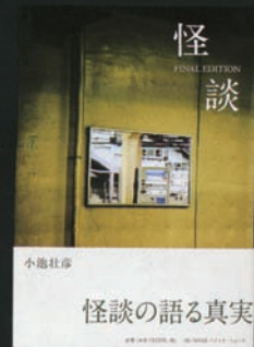
小池壮彦 「怪談の語る真実」 FINAL EDITION CL:INFAS / パブリケーションズ AD:山野英之 / D:田中尊子 PH:藤田二朗 A1 明朝 (加工)