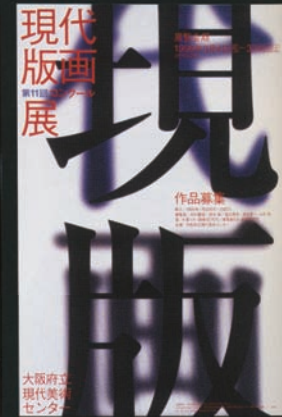
「第11回 現代版画 コンクール展」(1996) CL:大阪府立 現代美術センター / AD:杉崎真之助 リュウミン / 中ゴシックBBB / 見出ゴMB31