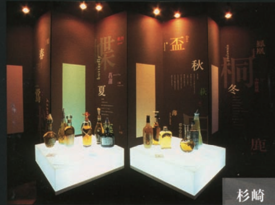
「山崎WHISKY NIGHT」(2001) CL:サントリー / AD:杉崎真之助 / C:杉崎史穂 リュウミン