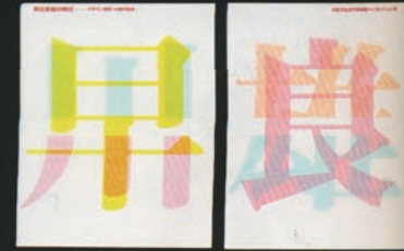
「早川良雄展」(2002) CL:大阪市立近代美術館建設準備室 AD:杉崎真之助 見出ミンMA31 / ゴシックMB101